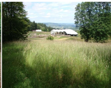
Bibracte et le mont Beuvray