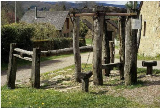
Travail à ferrer au Mont