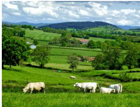
Paysage du Morvan