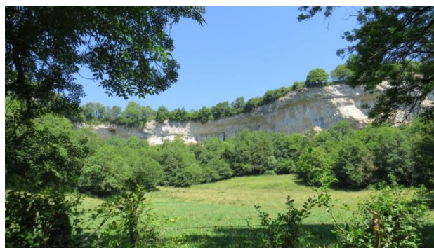
Le cirque du Bout du Monde

Puis route vers le lieu d'hébergement (50kms, 50 mn) "La maison du Beuvray" 71990 St Léger sous Beuvray (Saône et Loire) https://maisondubeuvray.org/