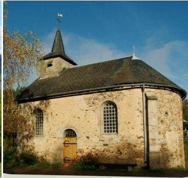
Chapelle Sainte Claire de Velée