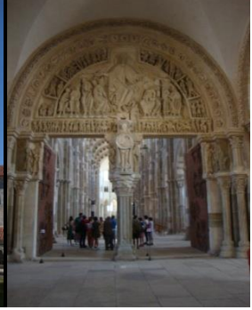
Château de Bazoches et Vézelay